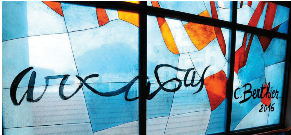
Sur l'un des vitraux qui vient d'être installé, la signature des artistes : Arcabas et Christophe Berthier, le maître verrier grenoblois complice du peintre-sculpteur.